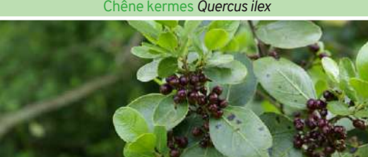
Nerprun alatern Rhamnus alaternus