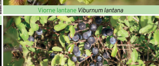
Prunellier Prunus spinosa