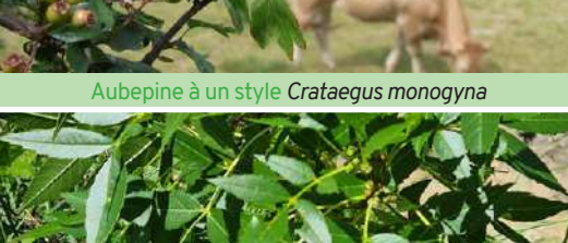
Frêne à feuilles étroites Fraxinus angustifolia