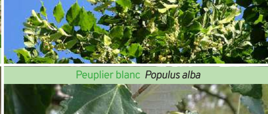
Peuplier blanc Populus alba