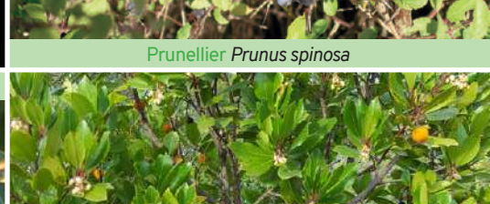
Arbousier commun Arbutus unedo