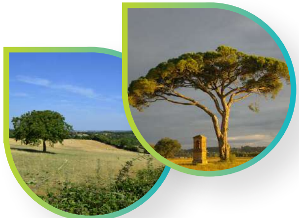
Pin parasol, Tarn