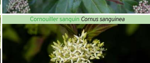
Cornouiller sanguin Cornus sanguinea