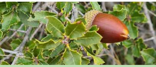
Chêne kermes Quercus ilex