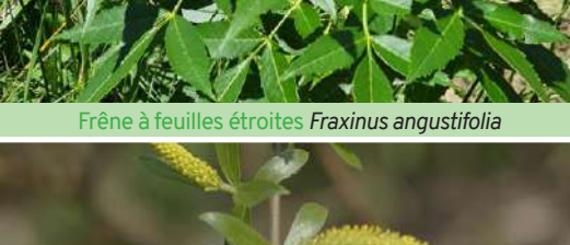
Saule Blanc Salix alba