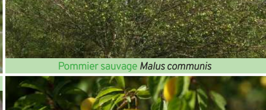
Prunier myrobolan Prunus cerasifera