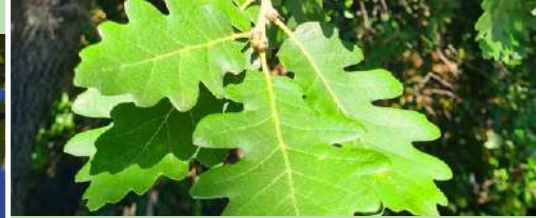
Chêne blanc Quercus pubescens