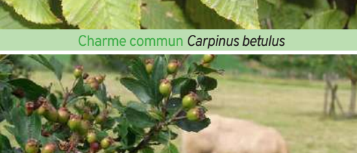
Aubepine à un style Crataegus monogyna