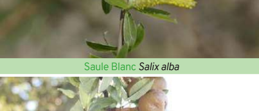
Poirier sauvage Pyrus communis