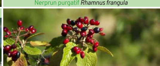
Viorne lantane Viburnum lantana