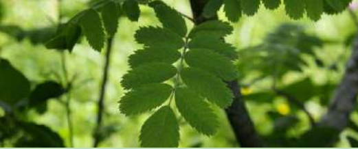
Cormier Sorbus Domestica