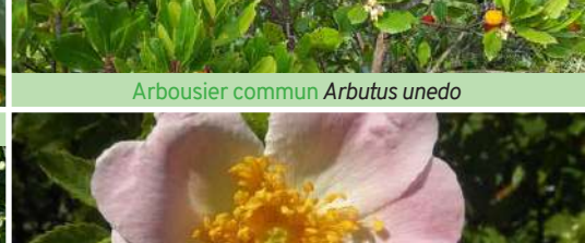
Eglantier des chiens Rosa canina