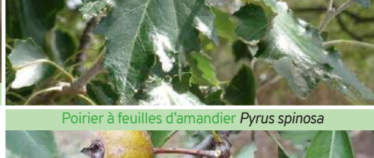
Poirier à feuilles d'amandier Pyrus spinosa