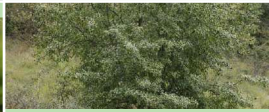
Nerprun purgatif Rhamnus frangula