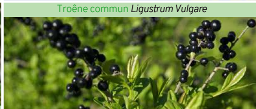
Troëne commun Ligustrum Vulgare