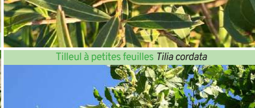
Tilleul à petites feuilles Tilia cordata