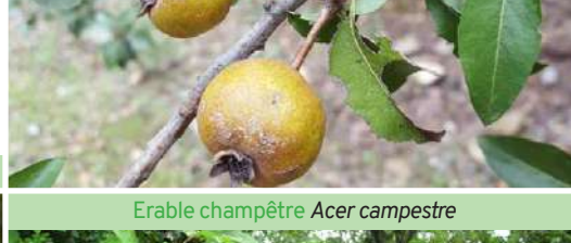
Érable champêtre Acer campestre