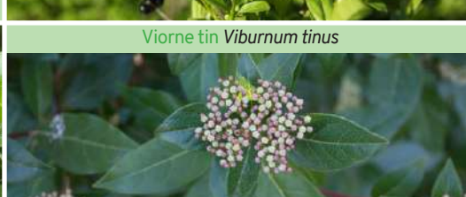
Viorne tin Viburnum tinus