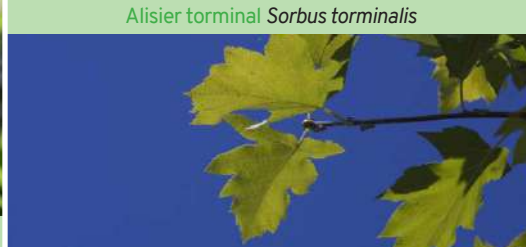
Alisier torminal Sorbus torminalis