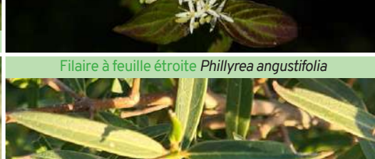
Filaire à feuille étroite Phillyrea angustifolia